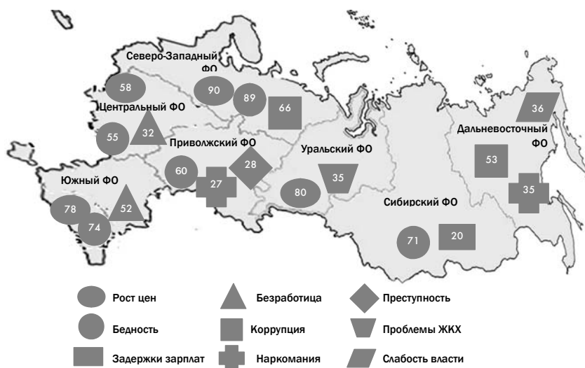
Рис. 2. Наиболее острые проблемы в федеральных округах, %

О различных мерах по развитию экономики в общей сложности говорит чуть более трети населения — 35%. Так, 14% россиян предлагают государству больше внимания уделять малому и среднему бизнесу, оказывая