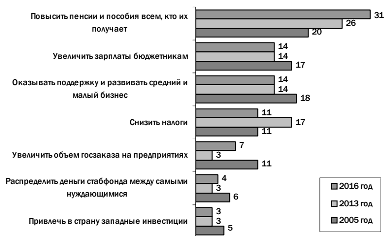
Рис. 3. Как вы считаете, что в первую очередь должна сделать власть, чтобы повысить благосостояние народа?, % Общая сумма менее 100%, т. к. не представлены варианты «другое» и «затрудняюсь ответить».