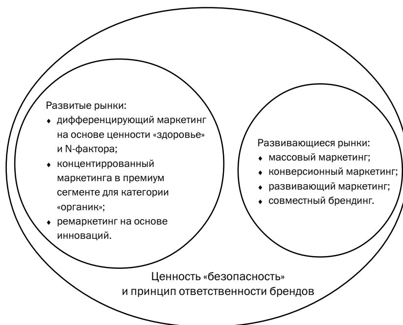
Рис.1. Модель развития глобального рынка продуктов питания для детей до трех лет