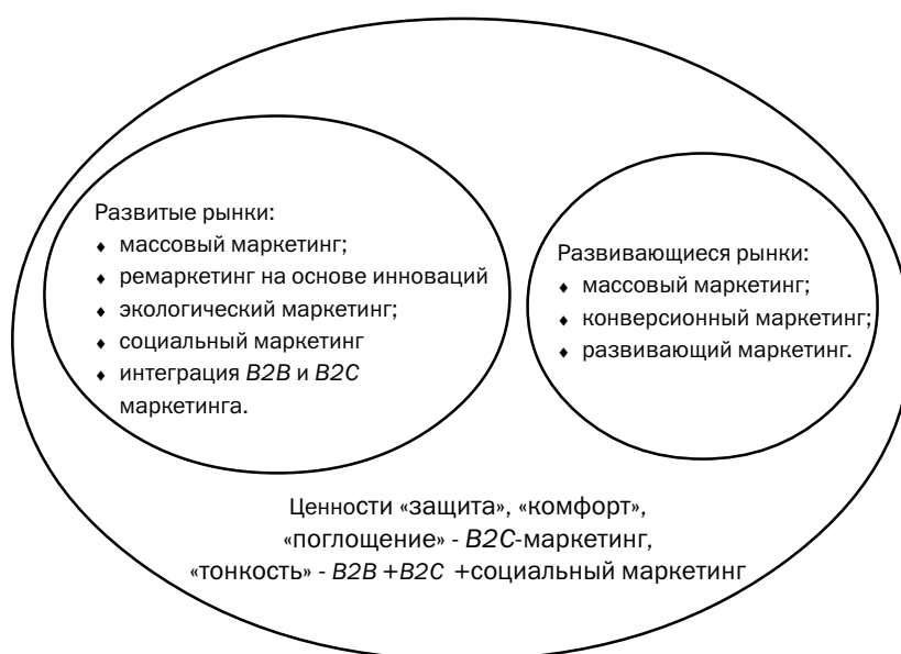
Рис. 2. Модель развития глобального рынка подгузников для детей до трех лет